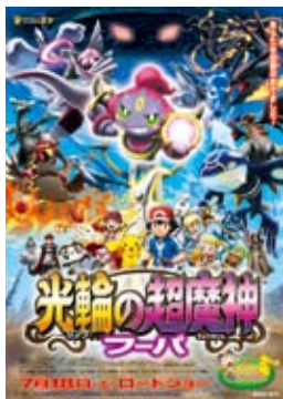
©Nintendo・Creatures・GAME FREAK・TV Tokyo・ShoPro・JR Kikaku ©Pokémon ©2015 ビカチュウプロジェクト

8月7日公開のシリーズ第11作目となる「BORUTO -NARUTO THE MOVIE-」は、シリーズ最高興収25.9億円を記録しました。舞台「ライブ・スペクタクル NARUTO-ナルト-」や展覧会「連載完結記念 岸本斉史 NARUTO-ナルト-展」も大盛況で、うずまきナルトが2015年を疾走しました。