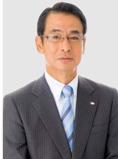
株式会社テレビ東京ホールディングス 株式会社テレビ東京 代表取締役社長

製作出资している『妖怪ウォッチ』はアジア各国や米国で放送が始まったほか、欧州、中近東でも放送を予定しております。また、アジアを中心とする海外市場において『NARUTO』の商品化展