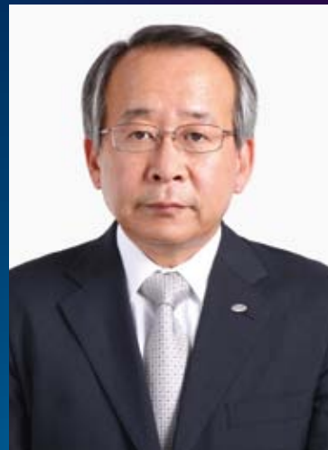
株式会社BSジャパン 代表取締役社長

BSジャパンは、事業環境の変化に対応しつつ、技術革新の波を乗りこなしながら、これからも着実に前進をしてまいります。そのため日本経済新聞社、テレビ東京との連携という強みを活かして報道・教養・スポーツなど各分野で新たな番組づくりに挑戦し、テレビ東京ホールディングスの株主や視聴者の皆様の期待に応えてまいります。BSデジタル放送へのご理解を深めていただくとともに、永きにわたるご支援を賜りますようお願い申し上げます。